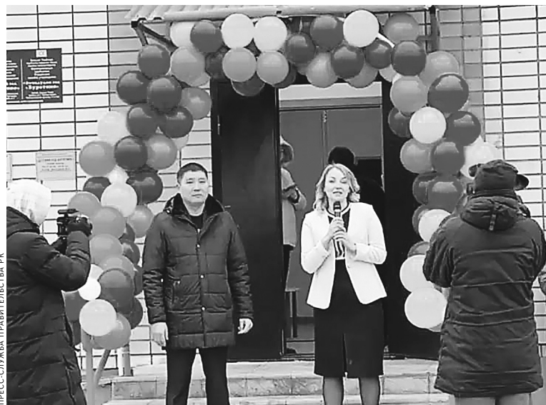
Для жителей Троицкого открытие детского сада стало праздником.