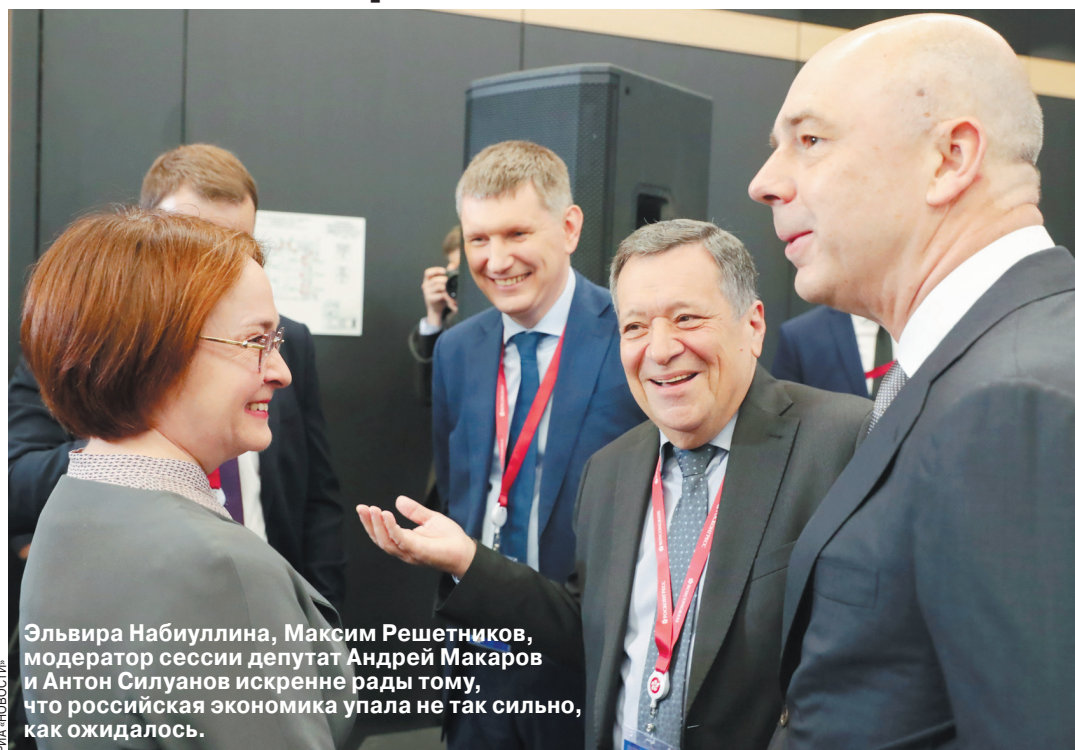
Эльвира Набиуллина, Максим Решетников, модератор сессии депутат Андрей Макаров и Антон Силуанов искренне рады тому, что российская экономика упала не так сильно, как ожидалось.

На ПМЭФ рассказали о финансовых перспективах России