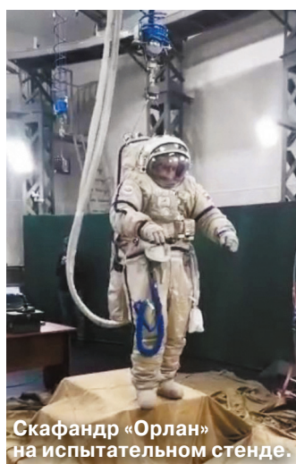
Скафандр «Орлан» на испытательном стенде.

Российский лунный скафандр впервые испытали в условиях пониженной гравитации