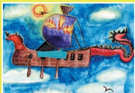
Дима Заполин, г. Оренбург

Ребята получают по почте книги от издательства «Эксмо»!