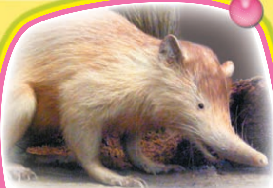
ОЧЕНЬ редкий ЗВЕРЬ