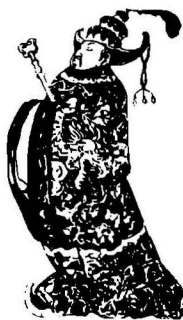
Женщина в костюме из серии «Посев» 1985 г.