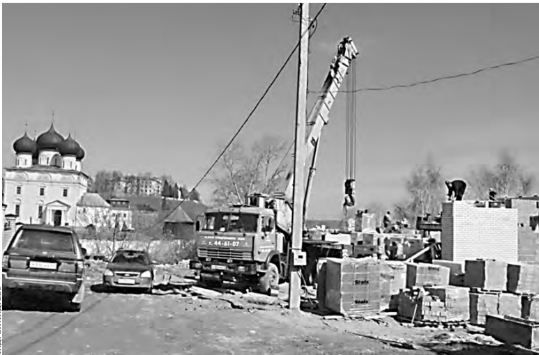
Застройщик на свой страх и риск начал возводить дом возле Успенского собора Трифонова монастыря.

Судебное заседание назначено на 16 мая. По словам специалистов управления градостроительства и архитектуры, это не первый случай, когда городская власть пытается защитить исторический облик города в суде.