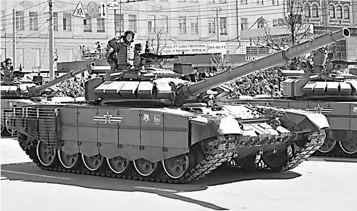
Вчера в приволжской столице на площади Минина и Пожарского состоялся военный парад войск Нижегородского гарнизона, во время которого прошли 47 единиц военной техники. В том числе — танки Т-72Б3 (на снимке) с улучшенными боевыми характеристиками. Бронемашина с новым боевым обвесом испытана при современных локальных боевых конфликтах.