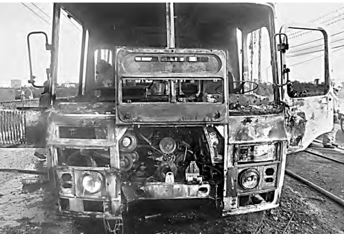
За несколько минут автобус сгорел дотла.