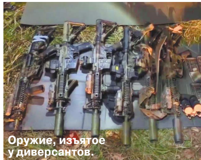
Оружие, изъятые у диверсантов.