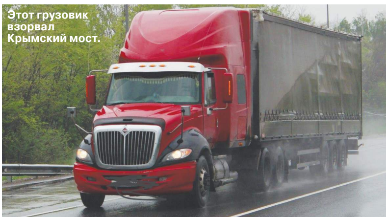
Этот грузовик взорвал Крымский мост.