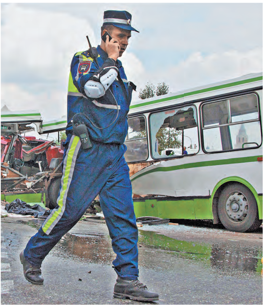
От автосалона до аварии: почему автобусы-красавцы превращаются в «смерть на колесах»?