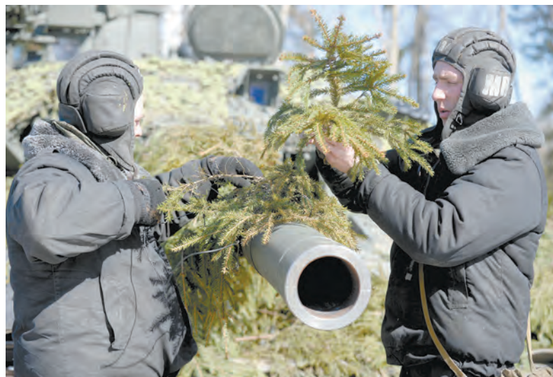
Маскировка должна быть тщательной

500 военнослужащих и свыше 200 единиц вооружения, военной и специальной техники были задействованы в учении