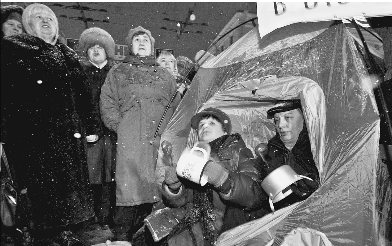
В воскресенье в Санкт-Петербурге льготники перекрыли Невский проспект, установив на нем несколько ОРАНЖЕВО-ГОЛУБЫХ ПАЛАТОК

Стихийные митинги и демонстрации льготников по всей стране вынудили местные и федеральные власти по сути свести на нет реформу по монетизации льгот. Льготникам, получившим компенсации, теперь возвращают и сами льготы. Таким образом, попытка сэкономить бюджетные деньги обернулась дополнительными незапланированными расходами. Однако акции протеста продолжаются.