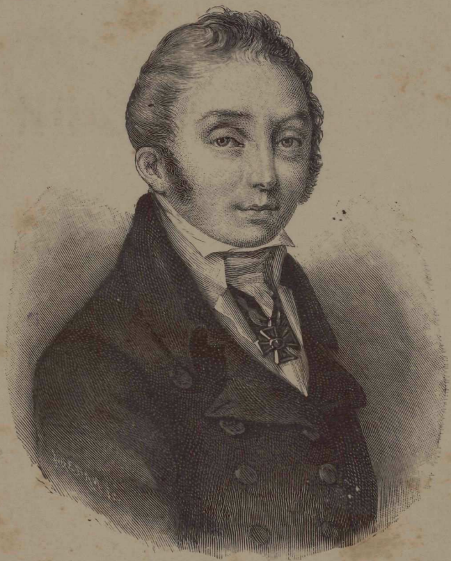
М. М. Сперанскій.