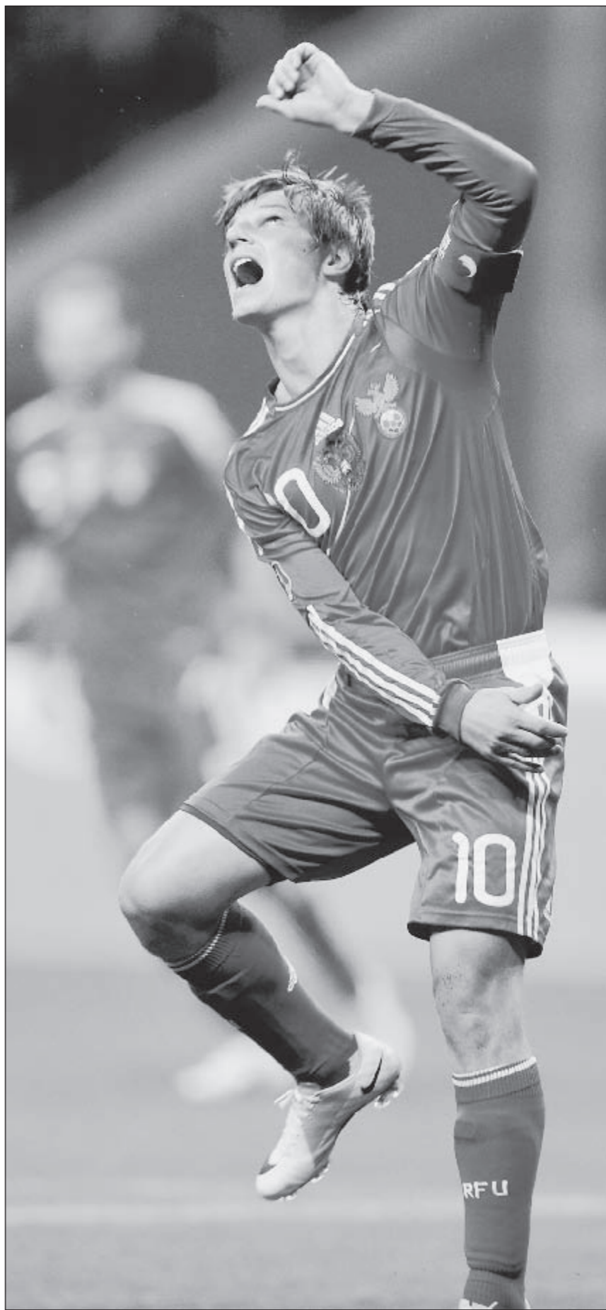
Вторник. Москва. Лужники. Россия - Андорра - 6:0. Капитан сборной России Андрей АРШАВИН.

Окончание и другие материалы об отборочных матчах Евро-2012 - стр. 2 - 5