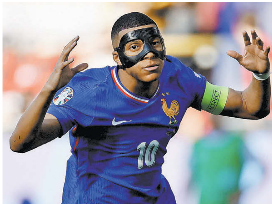
Вчера. Дортмунд. Франция – Польша – 1:1. Килиан Мбаппе