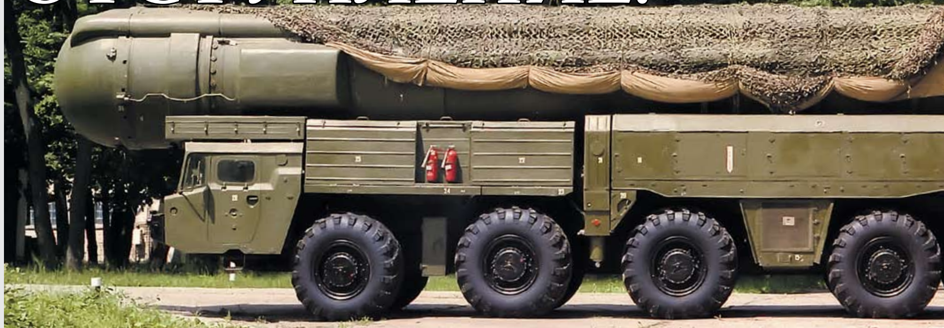
РСД-10 «Пионер», уничтоженные согласно Договору по РСМД

ПОДГОТОВКА СНВ-3 НАПОМИНАЕТ ИСТОРИЮ ДОГОВОРА СНВ-1, ПОЛНУЮ ОШИБОК И СДАЧИ ПОЗИЦИЙ