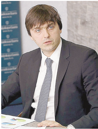
Сергей Кравцов, министр просвещения РФ

Главный ведомства пообещал также всестороннее содействие в создании центра федерального строительного контроля Омской области. ●