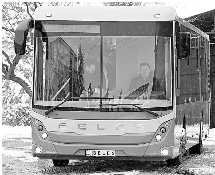
ПРЕСС-СЛУЖБА ПРЕЗИДЕНТА КР

Для решения транспортных проблем столицы Киргизии, по данным мэрии, необходимо выпускать на линии как минимум 1,5 тысячи автобусов большой вместимости. Таким количеством муниципальных машин Бишкек не располагает. Ежедневно на линии выпускают лишь около 90 автобусов и чуть более сотни троллейбусов. Пассажирское сообщение в городе поддерживается в основном благодаря частным перевозчикам, эксплуатирующим микроавтобусы.