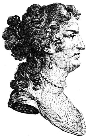
ADAME DE MAINTENON .