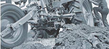
Нашему сельхозмашиностроению по силамдержать 80–90% рынка РФ.