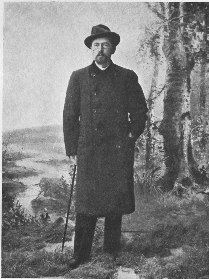
А. П. Чеховъ въ 1898—99 гг.