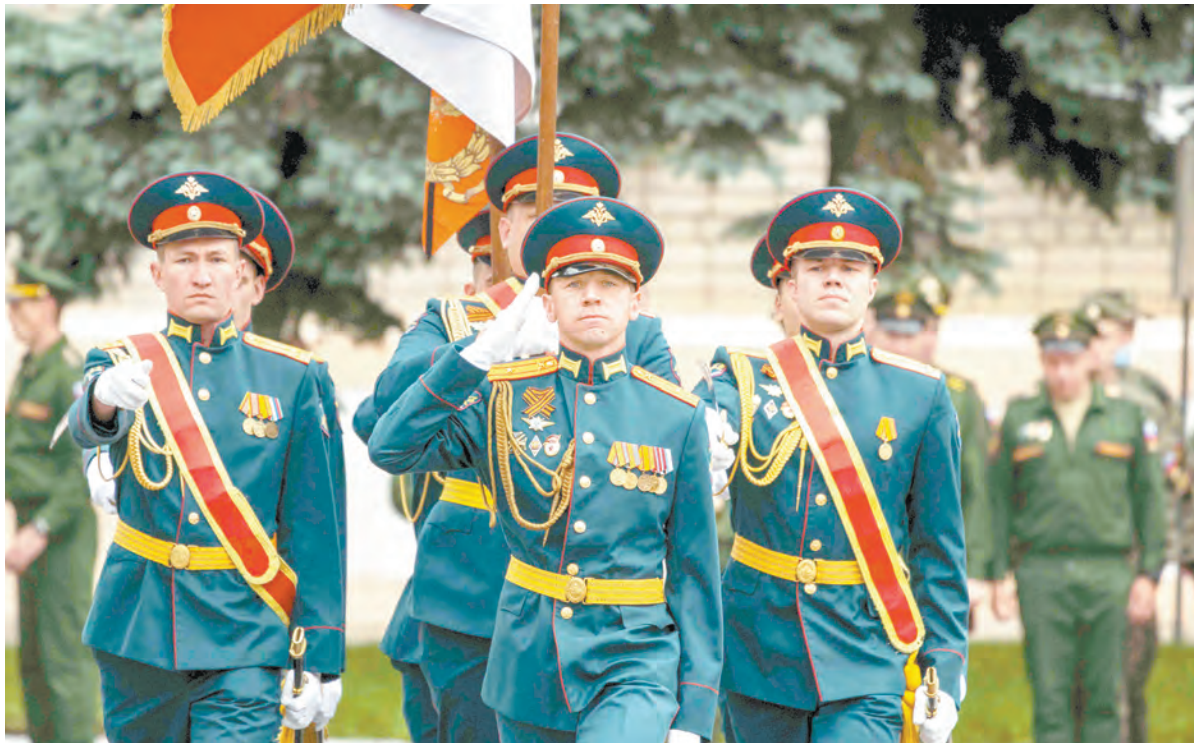
Равнение за Знамя

1 июня в соединениях и воинских частях ЗВО состоялись торжественные митинги, посвящённые началу летнего периода обучения. На кораблях Балтийского флота были подняты Андреевские флаги и флаги расцветивания. На построении командиры озвучили задачи по боевой подготовке, которые ждут военнослужащих в ближайшие месяцы.