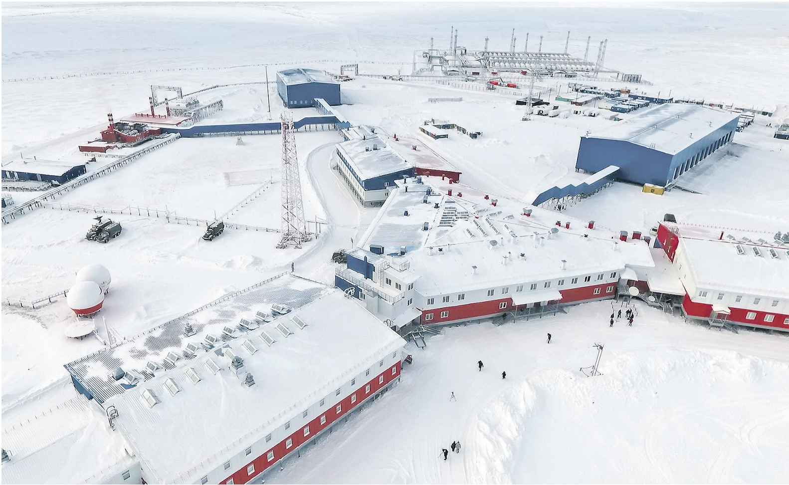
Административно-жилой комплекс «Северный клевер» с высоты птичьего полёта.

Как поясняют вертолётчики, иногда в таком зале можно провести несколько недель в ожидании лётной погоды. Арктический климат суров и непредсказуем. Если в этих краях утром светит солнце, то нет никакой гарантии, что через пару часов не поднимется метель, которая продлится несколько суток.