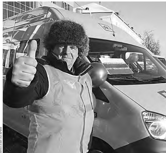
Сразу на 70 единиц обновился автопарк мордовских школ.

Записаться на прививку можно через интернет. На портале пенза-доктор.рф либо по QR-коду.