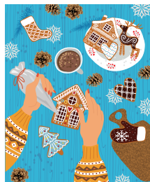
Рисунок на обложке: Shutterstock.com