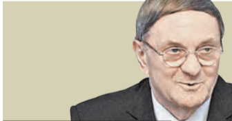
Петр Прокопович, вице-премьер Беларуси:

ВТОРОЙ этап Спартакиады Союзного государства для детей и юношества завершился в Пинске. Первый этап Спартакиады прошел в начале апреля в Пскове. До конца 2014 года запланированы следующие два этапа Спартакиады: в сентябре в Могилеве состоится Спартакиада учащихся «Олимп», а в октябре Спартакиаду учащейся молодежи примет Анапа. Спартакиада для детей и юношества проводится ежегодно.