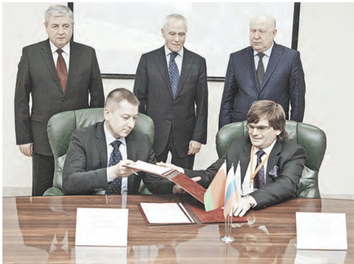
В рамках заседания Совета были подписаны договоры о сотрудничестве белорусских и нижегородских предприятий.

По итогам 2013 года товарооборот Нижегородской области с Республикой Беларусь составил 698,9 миллиона долларов США. Для сравнения: в 2005 году — до создания Совета делового сотрудничества — этот показатель не превышал 267 миллионов долларов. Экспорт из Нижегородской области в прошлом году составил 294,5 миллиона, импорт вырос на 8,4 процента, до 404,4 миллиона. В структуре экспорта преобладали грузовые, легковые автомобили, автобусы, запчасти для автомобилей, изделия из черных металлов, спирты ациклические, пищевая продукция. Импортировали нижегородцы из Беларуси в основном двигатели внутреннего сгорания, грузовые автомобили, автобусы, запчасти для автомобилей, тракторы, шины, сыры и творог, сахар, нефтепродукты.