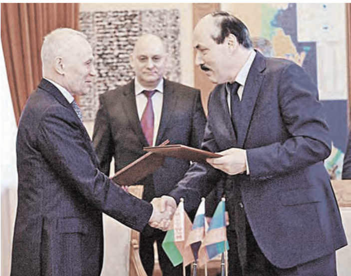
Григорий Рапота и Рамазан Абдулатипов подписали соглашение о сотрудничестве.