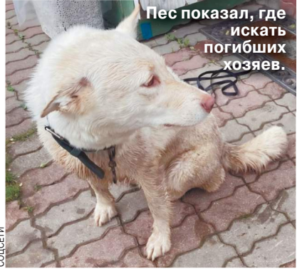
Пес показал, где искать погибших хозяев.

Несколько дней искали волонтеры и силовики пропавших без вести мужчину и его сына в Дмитровском городском округе. Они погибли при странных обстоятельствах во время прогулки с собакой. Как стало известно «МК», 12 июня 30-летний житель подмосковной деревни Муравьево и его 53-летний отец вышли из частного дома около 3.40, чтобы прогуляться с трехлетней собакой породы овчарка по кличке Альба. Исчезновение родственников замечила супруга главы семейства, однако столь поздняя прогулка ее не удивила — мужчины каждый день ходили гулять с собакой после полудня, объясняя это тем, что днем и вечером животное кидается на других людей и их собак.