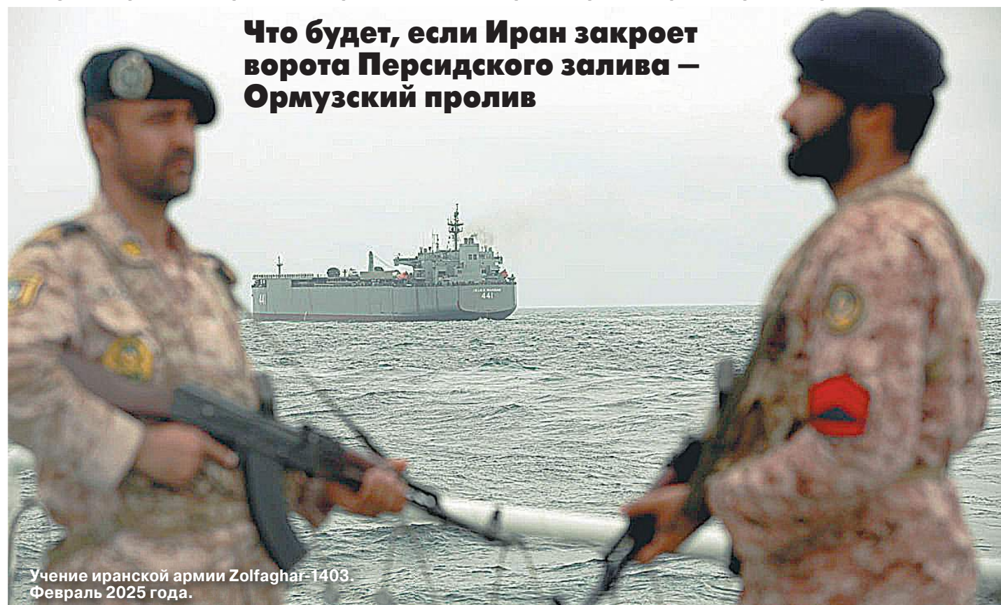
Учение иранской армии Zolfaghar-1403. Февраль 2025 года.

Что будет, если Иран закроет ворота Персидского залива — Ормузский пролив