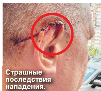
Страшные последствия нападения.