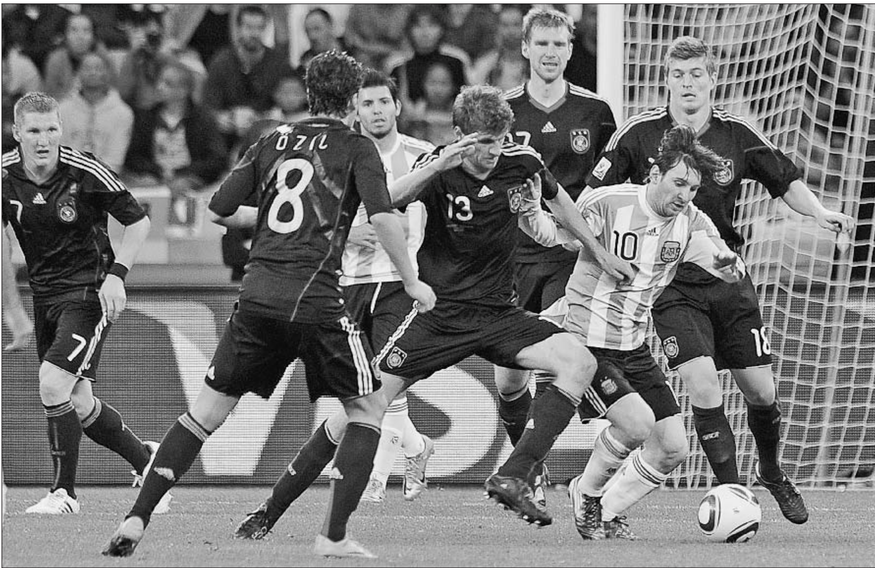
3 июля 2010 года. Кейптаун. Четвертьфинал ЧМ-2010. Аргентина - Германия - 0:4. В воскресенье в Рио-де-Жанейро они сойдутся вновь, теперь уже в финале: Бастиан ШВАЙНШТАЙГЕР (№ 7), Месут ЕЗИЛ (№ 8), Томас МЮЛЛЕР (№ 13), Пер МЕРТЕСАКЕР (№ 17) и Тони КРООС против Серхио АГУЭРО и Лионеля МЕССИ (№ 10).

В ночь со среды на четверг по московскому времени определился второй финалист чемпионата: сборная Аргентины в серии пенальти взяла верх над голландцами. Теперь на ЧМ осталось провести два матча. Завтра состоится игра за третье место Бразилия - Голландия. Ну а в воскресенье - финал: Германия против Аргентины. И всё.