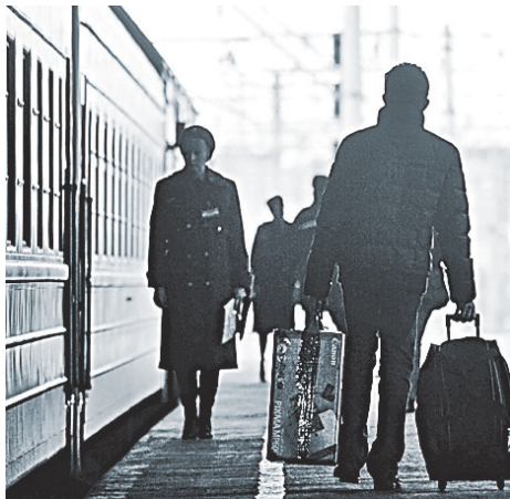
Люди боятся доверить багаж носильщику, а личные данные — Интернету.

КАБЕЛЬНЫЕ 6,11 ЦИФРОВЫЕ 18,18 IPTV 18,18 СПУТНИКОВЫЕ 65,65