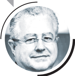
ЭММАНУЭЛЬ КИДЗ, ПРЕЗИДЕНТ ФРАНКО-РОССИЙСКОЙ ТОРГОВО-ПРОМЫШЛЕННОЙ ПАЛАТЫ

Франко-русская торгово-промышленная палата (ССИФР) выражает крайнюю озабоченность в связи с принятием Европейским союзом нового пакета экономических санкций, направленных против России.