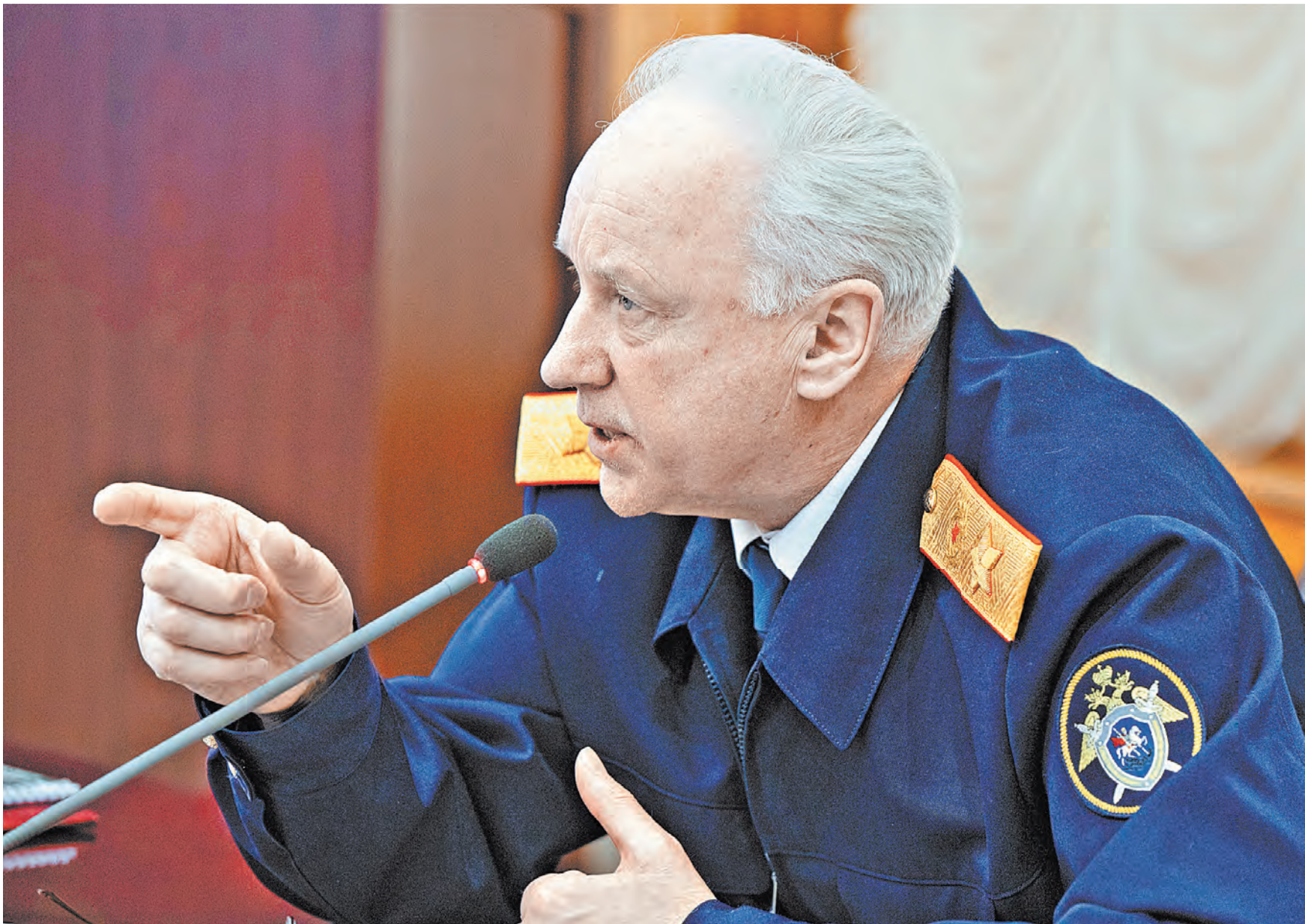
СЛЕДСТВЕННЫЙ КОМИТЕТ РФ