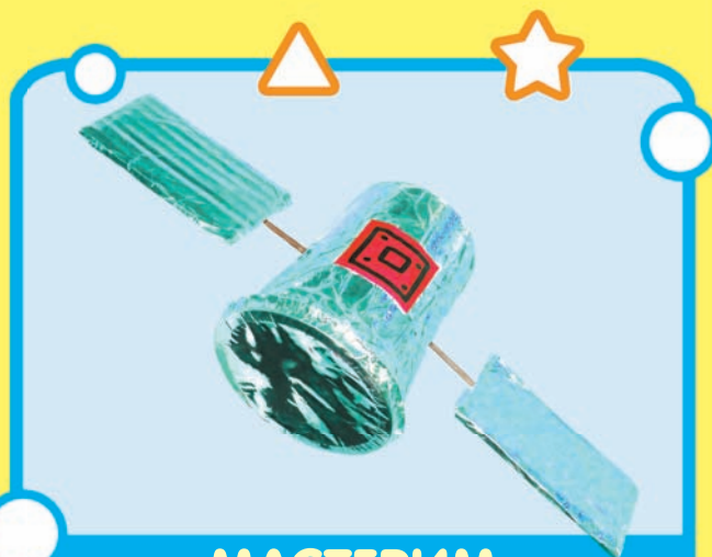
МАСТЕРИМ КОСМИЧЕСКИЙ КОРАБЛЬ