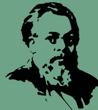
С. П. Боткин