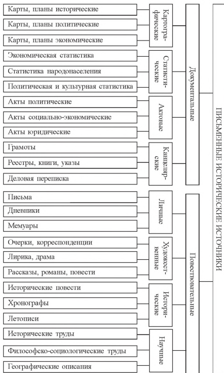
Линейная система классификации письменных исторических источников