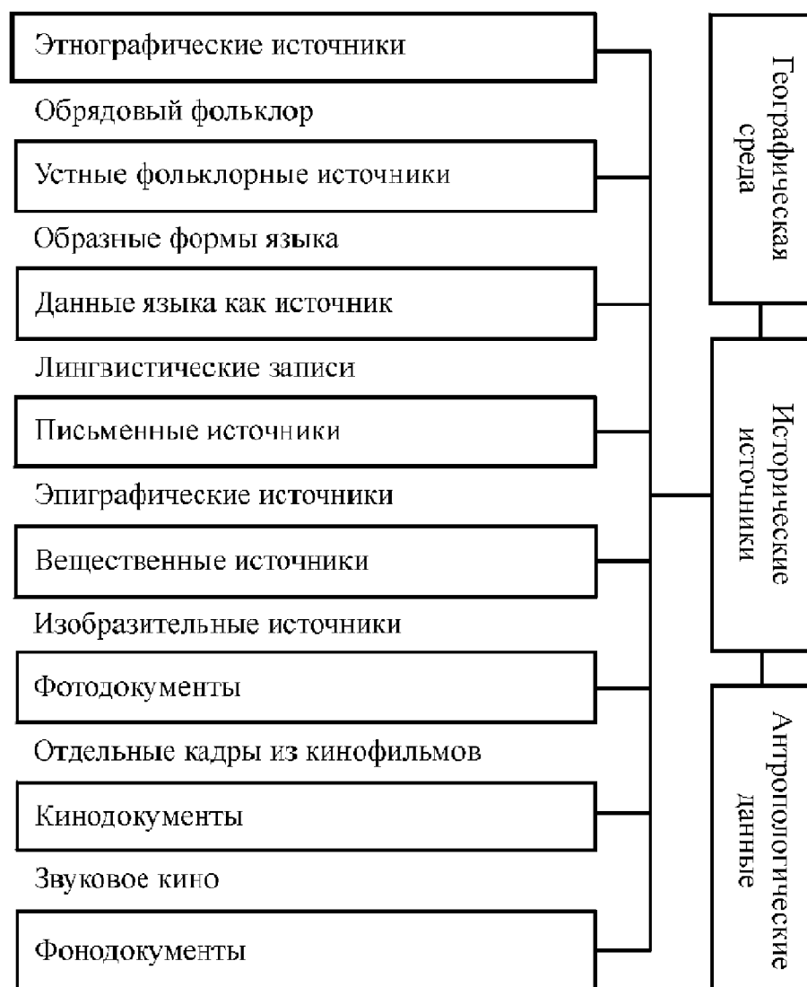
Линейная система классификации исторических источников