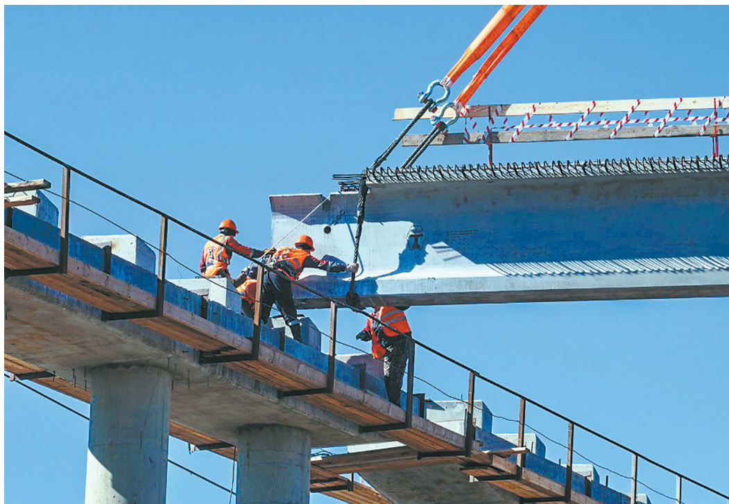
ПРЕСС-СЛУЖБА ГЛАВЫ РБ