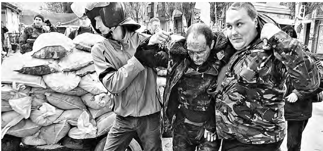
Жителям Славянска пока удается отбивать одну атаку за другой.

ВСТУПАЕТ В СИЛУ Наконец-то мы узнаем, сколько мяса в колбасе и есть ли молоко в мороженом