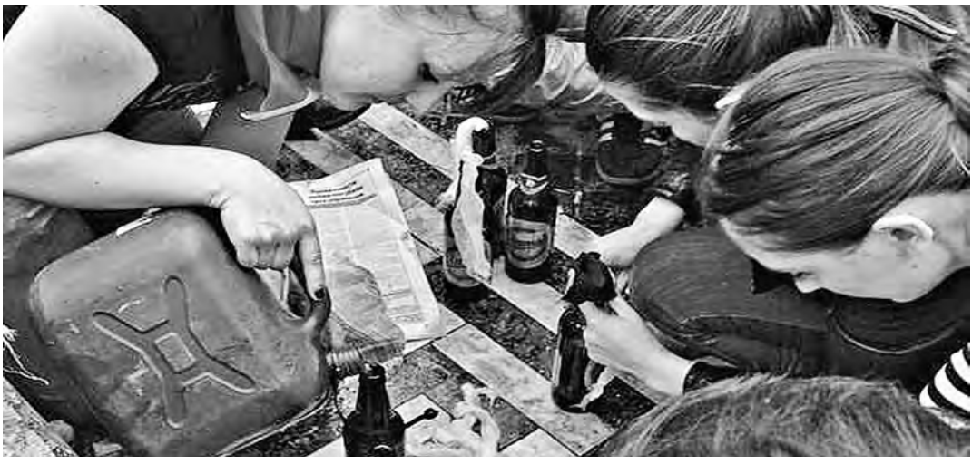
Активистки «Правого сектора» не скрывали, что готовят «коктейли Молотова» для поджога Дома профсоюзов.

КОНТРАКТ Россия готова перейти к предоплате за поставляемое Украине топливо