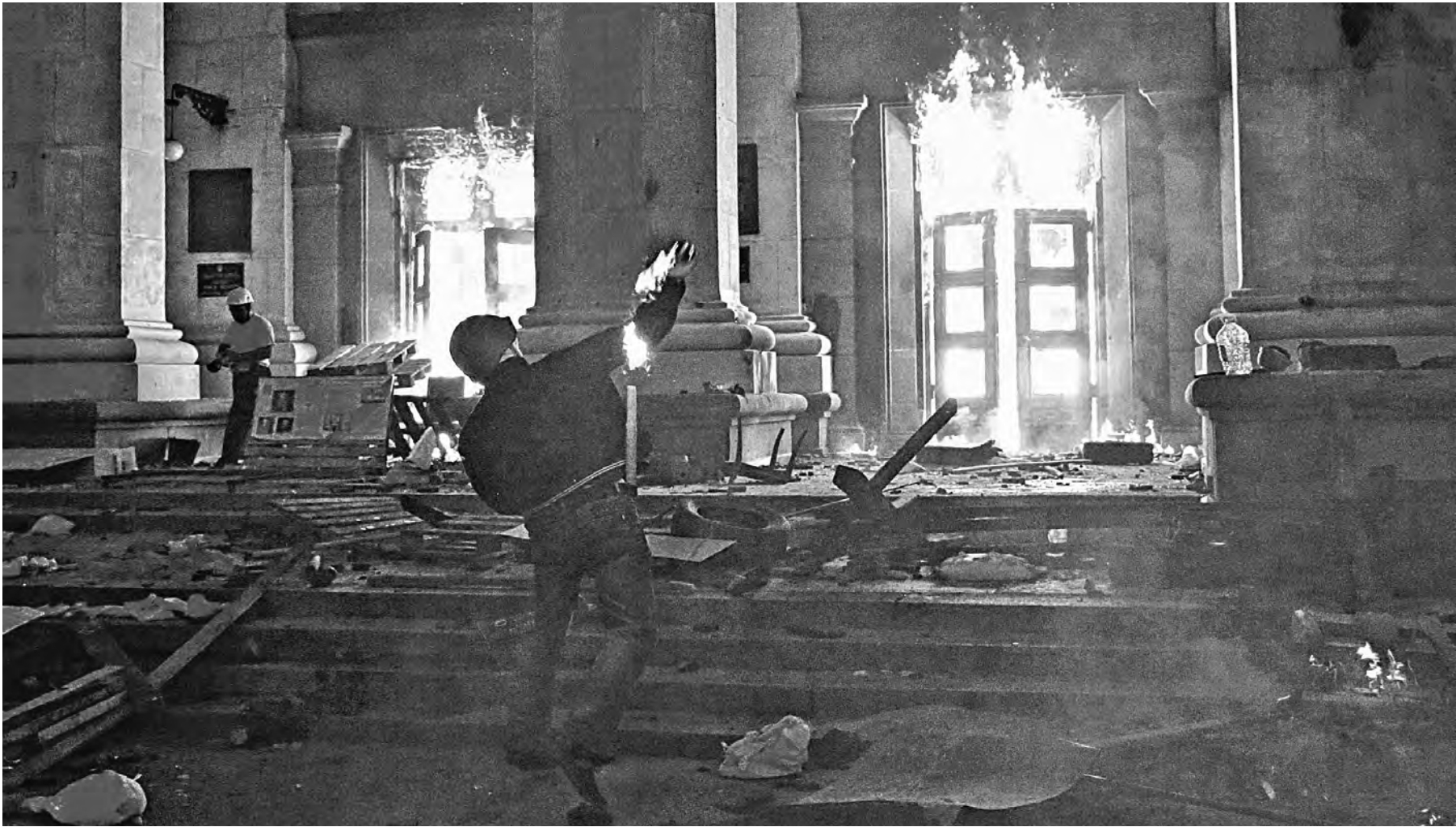
Дом профсоюзов в центре Одессы вспыхнул как свечка.

А вечером случилось то, что наверняка войдет в историю преступлений против человечности.