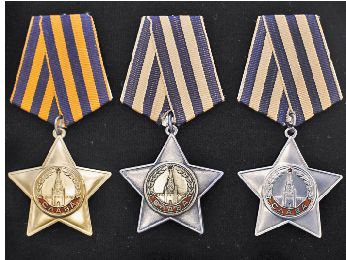
Орден Славы стал прямым аналогом Георгиевского креста — символом личного мужества и отваги в бою.

Сегодня общедоступная поисковая база «Звезды Победы» на сайте «Российской газеты» пополнилась именными сведениями о 8966 орденах Славы III степени, которые по разным причинам не были вручены фронтовикам.