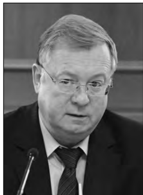
Сергей Степашин, президент Российского Книжного союза:

«Какие ожидания связаны у вас с 2015-м книжным годом, Годом литературы в России» — на этот вопрос отвечают руководители издательств, книготорговых предприятий, профессиональных объединений и ассоциаций, писатели.