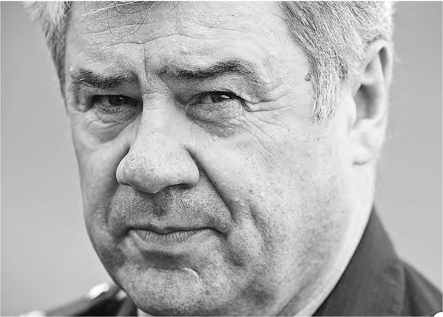
Будучи главкомом ВВС Виктор Бондарев стоял у истоков создания Су-57. Тогда самолет назывался «перспективный авиакомплекс фронтовой авиации».

РЕЛИГИЯ Священный синод РПЦ вынужден полностью разорвать евхаристическое общение с Константинопольским патриархатом