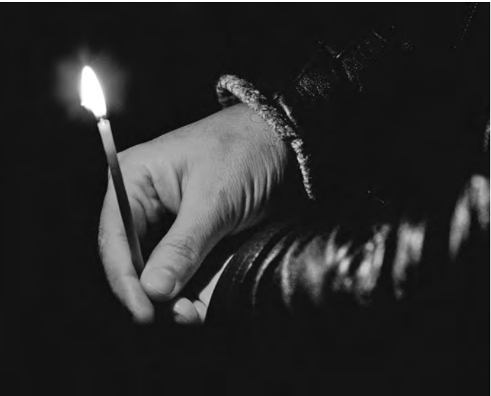
Синод РПЦ вывел Константинополь за пределы канонического поля.

И вот вечером в понедельник решение Священного синода было объявлено: полный разрыв евхаристического общения. — На сегодняшнем заседании Священного синода было принято решение о полном разрыве евхаристического общения с Константинопольским патриархатом, — заявил журналистам глава отдела внешних церковных связей митрополит Волоколамский Иларион. — Это было вынужденное и тяжелое решение, но иного решения не мог принять наш Священный синод, поскольку к этому веда вся логика последних действий Константинопольского патриархата. Решения предыдущего Синода РПЦ от 14 сентября утверждали частичный разрыв обще-