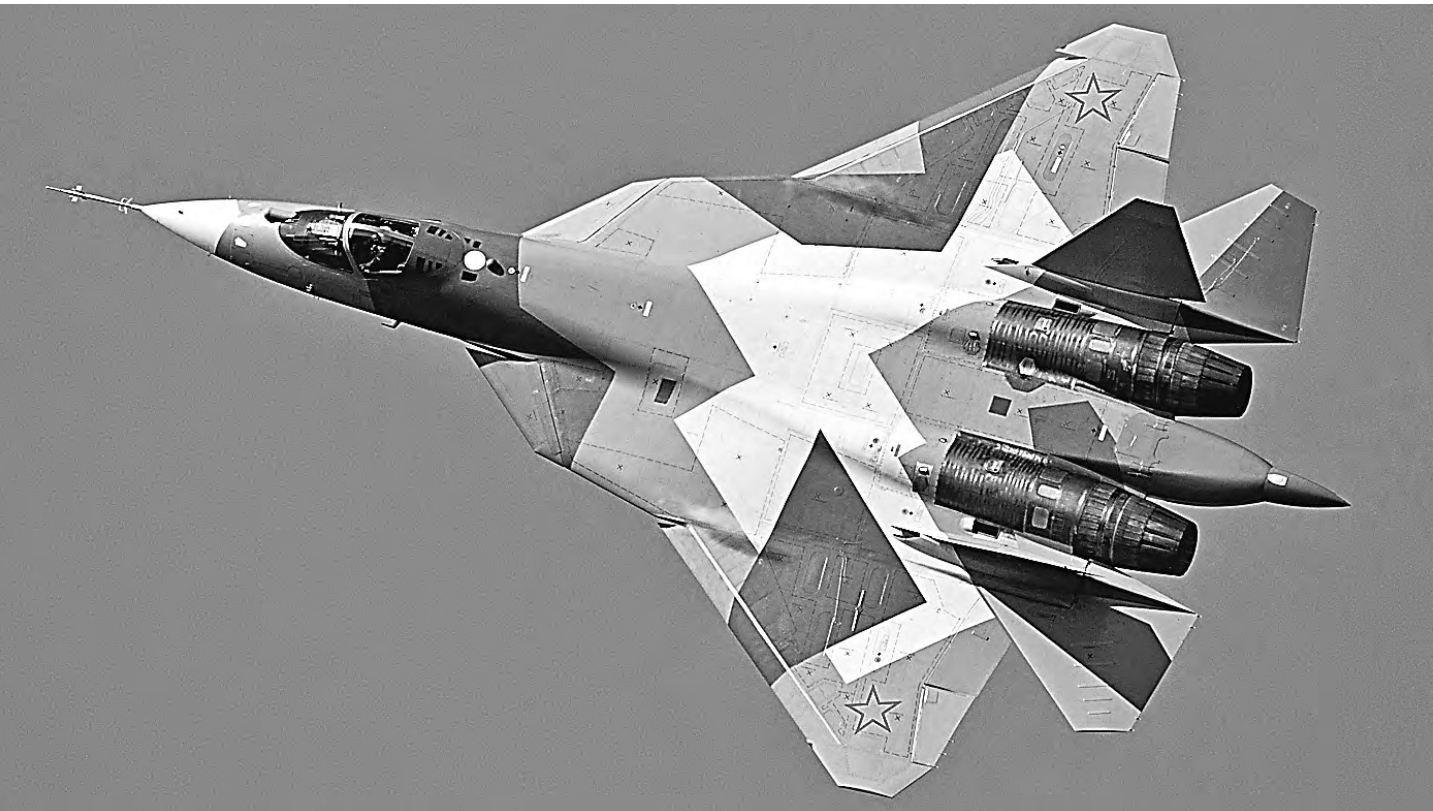
Благодаря своей силовой установке истребитель Су-57 летает на сверхзвуковой бесфорсажной крейсерской скорости.