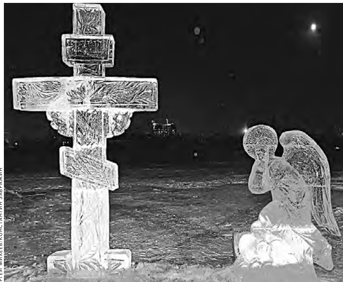
Каждый имеет право жить и верить, как ему хочется. Тебе не нравится? Отойди в сторону.