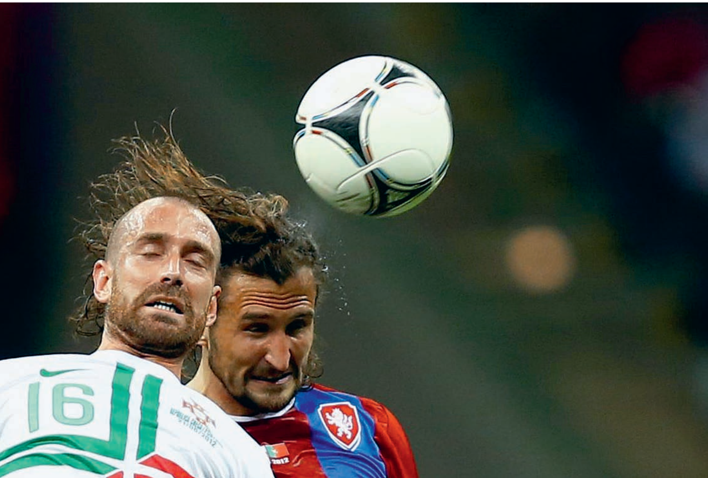
ЧЕТВЕРТЬФИНАЛ ЕВРО-2012. ЧЕХИЯ ИГРАЕТ С ПОРТУГАЛИЕЙ. САМЫЕ ЛУЧШИЕ МОМЕНТЫ ЗАКАНЧИВАЮЩЕГОСЯ ЧЕМПИОНАТА В ФОТОГРАФИЯХ