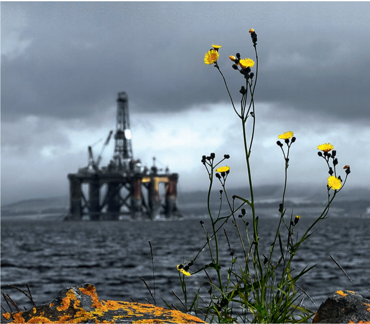
Нефть выбрала для падения именно 8 марта. Неженское это дело – бурить.

«В 2017 году ожидается формирование устойчивого структурного профицита ликвидности в банковском секторе», – прогнозирует Банк России.