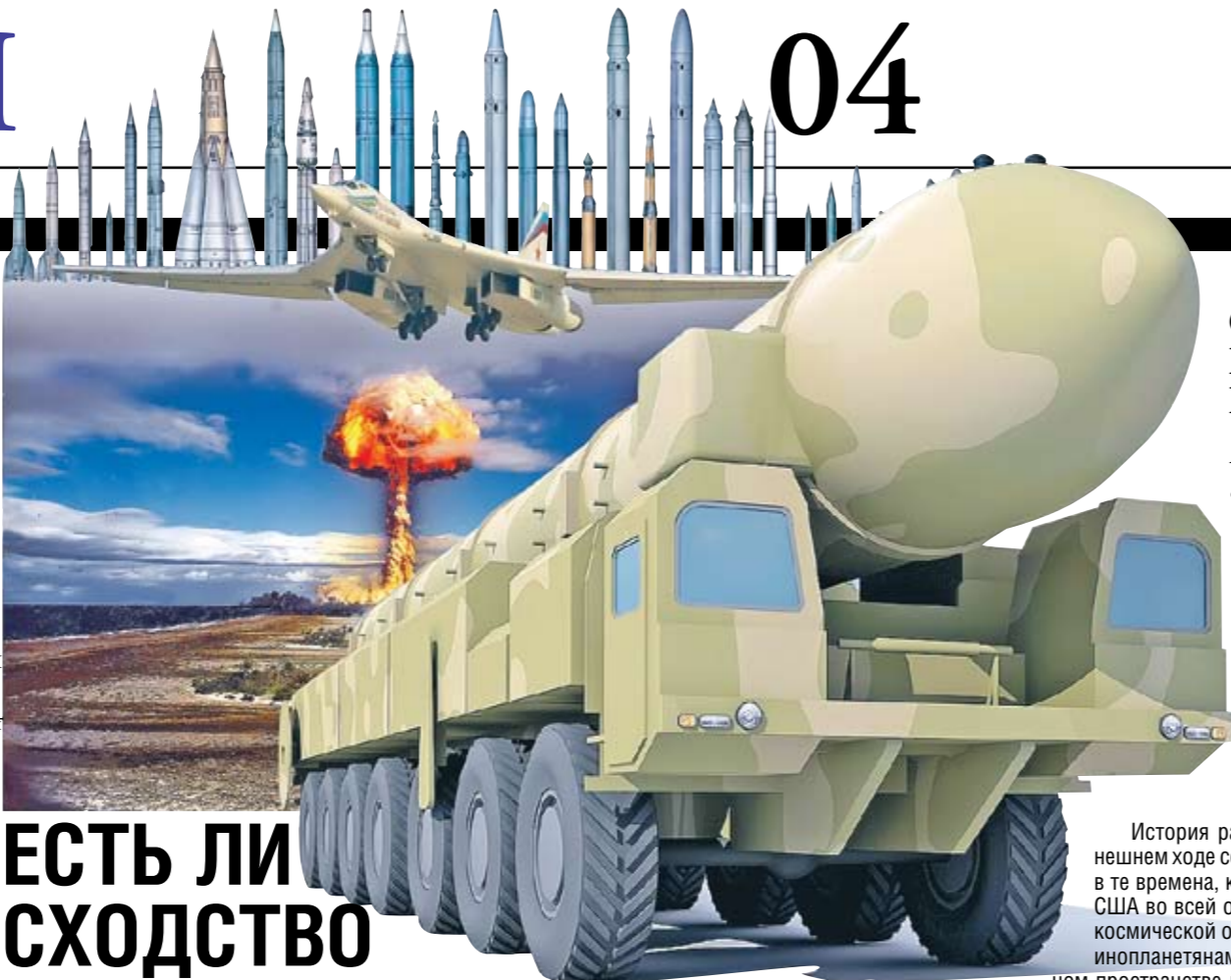
Коллаж Андрея СЕДУХ

И еще один пример конкретной ситуации, возникшей из-за дефицита доверия между двумя государствами. В Козельске дислоцируется дивизия РВСН, оснащенная стационарными ракетными