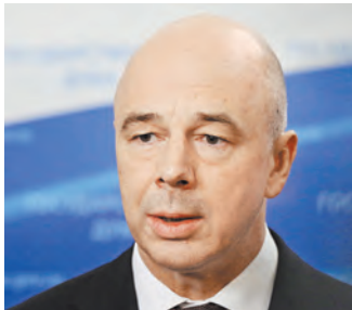
Антон Силуанов: При покупке ОФЗ есть налоговые льготы для частных инвесторов.

Начинающим инвесторам в первую очередь стоит обратить внимание на ОФЗ с постоянным купонным доходом (ОФЗ-ПД).