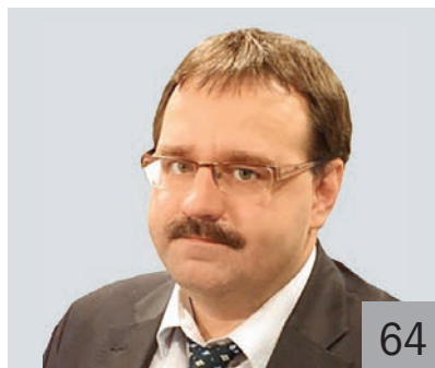
С. С. БЫЧКОВ, действительный государственный советник РФ 3-го класса