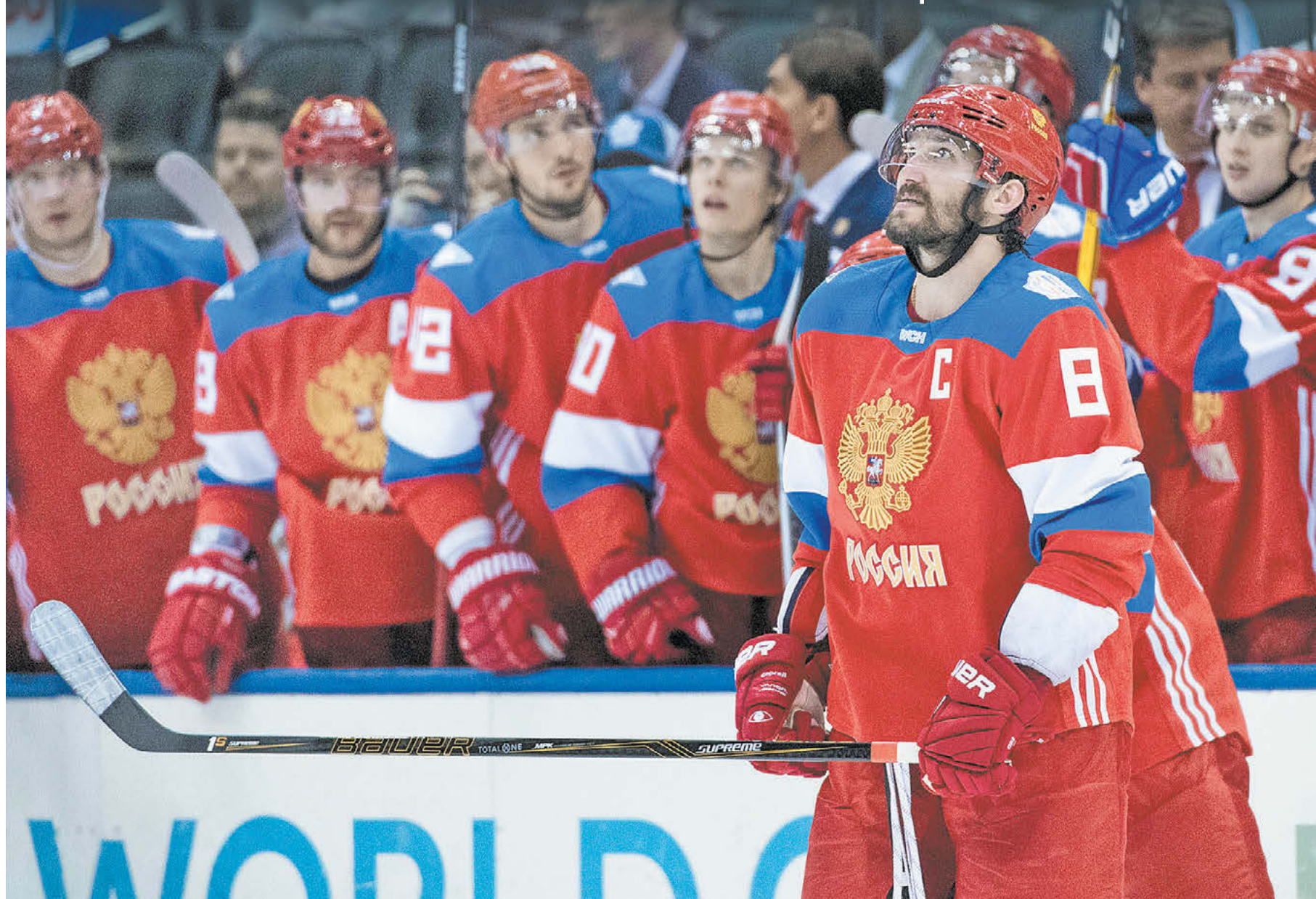
22 сентября 2016 года. Торонто. Россия – Финляндия – 3:0. На том Кубке мира Александр Овечкин с партнерами дошли до полуфинала

Кубок мира-2025 пройдет без нашей сборной