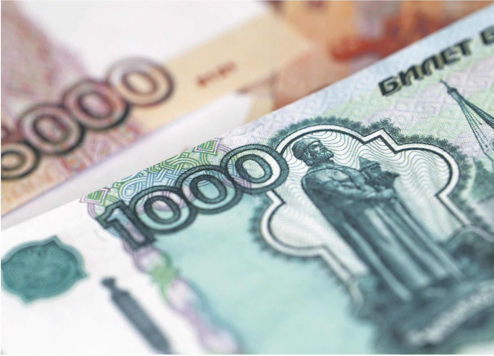
Дмитрий Коротаев / Известия

Среди причин — возможный дополнительный спрос на живые деньги в новых регионах России, пояснили в ЦБ. Кроме того, население традиционно склонно снимать часть выплат из бюджета в наличной форме.