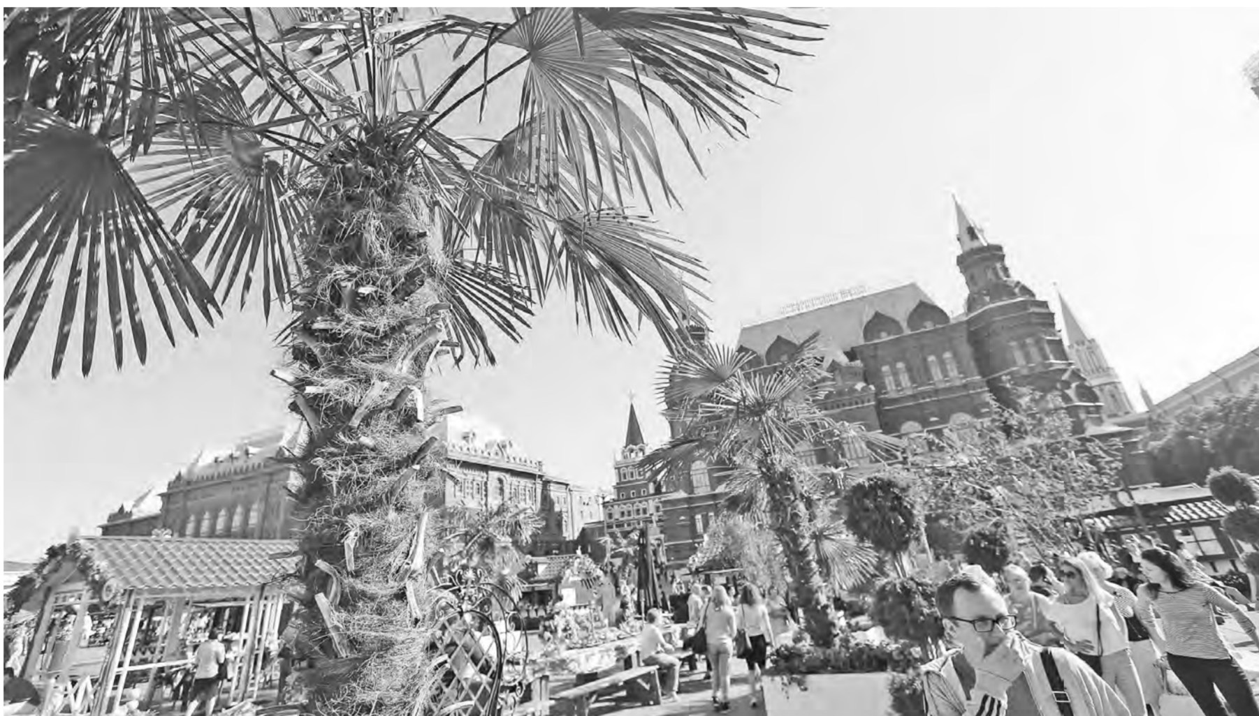
Россияне уже съели столько пальмового масла, что появление самих пальм вблизи от Кремлевских стен не удивляет.