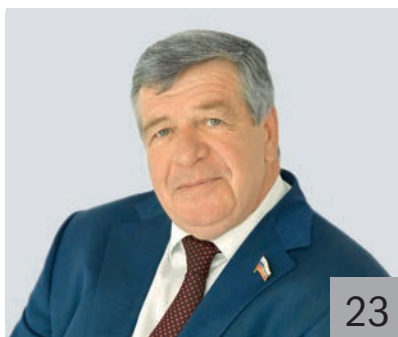
В. В. СЕМЕНОВ, член Комитета Совета Федерации по бюджету и финансовым рынкам