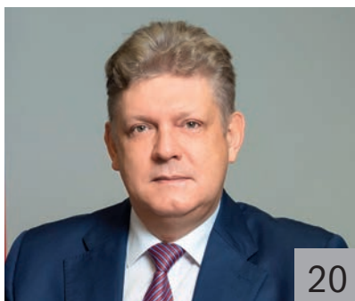
А. А. СЕРЫШЕВ, полномочный представитель Президента РФ в Сибирском федеральном округе

Подъем Сибири и Дальнего Востока является одной из стратегических целей развития страны. Это возможность занять достойное место в Азиатско-Тихоокеанском регионе, самом энергично развивающемся регионе мира.