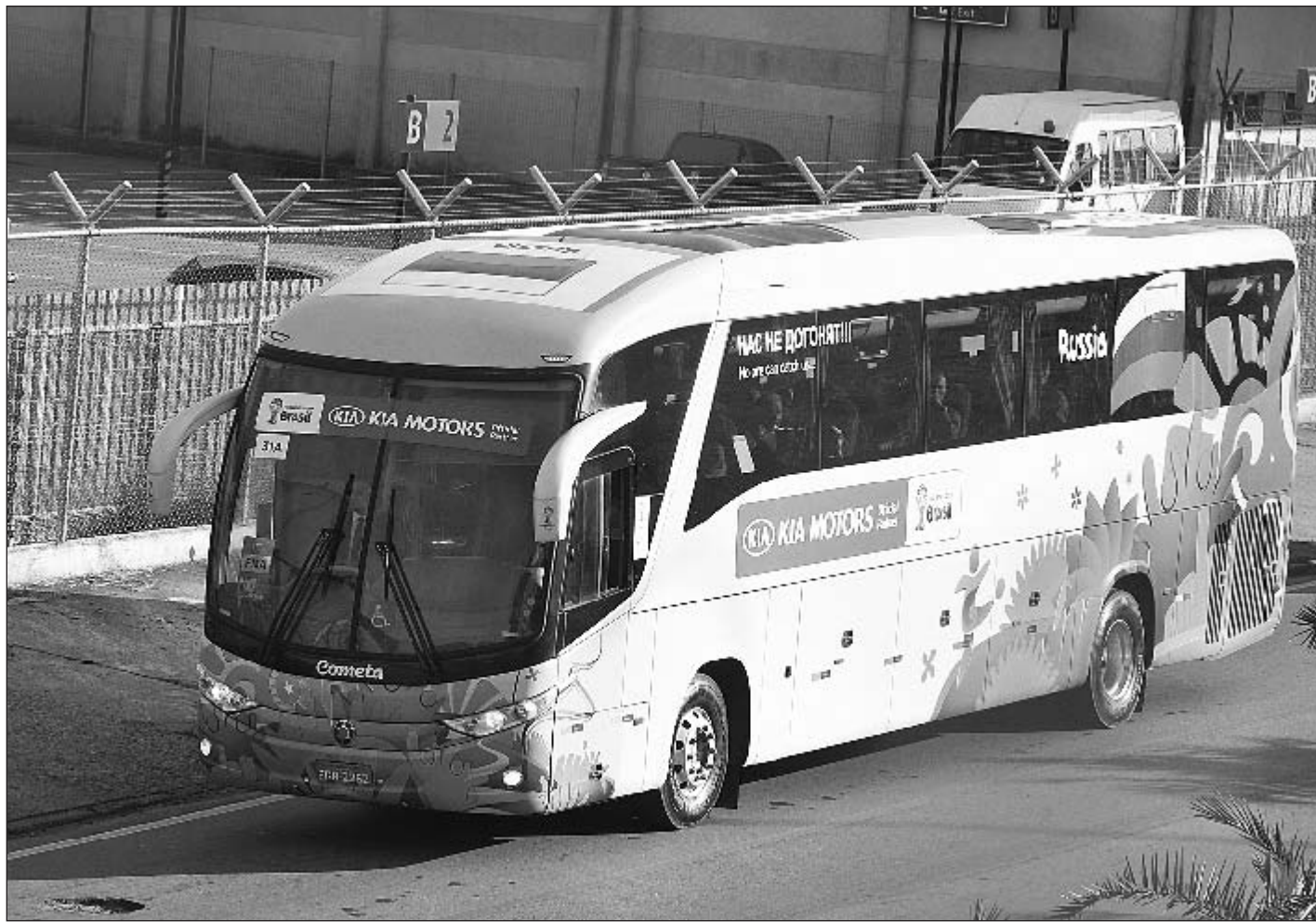
Вчера. Автобус сборной России покидает аэропорт Гуарульос.