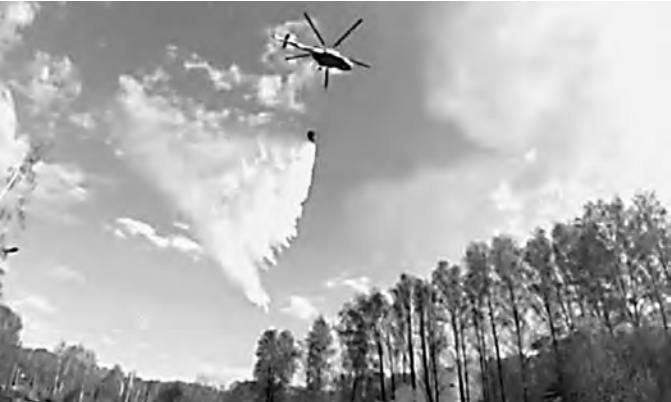
Тушить пожар, начавшийся после взрыва, прилетела авиация.