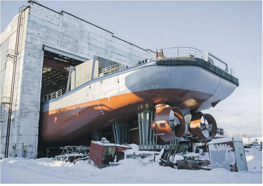
Ярославский судостроительный завод