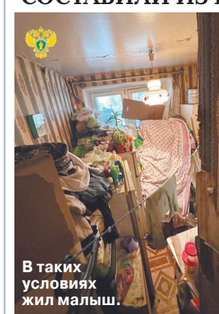
В таких условиях жил малыш.