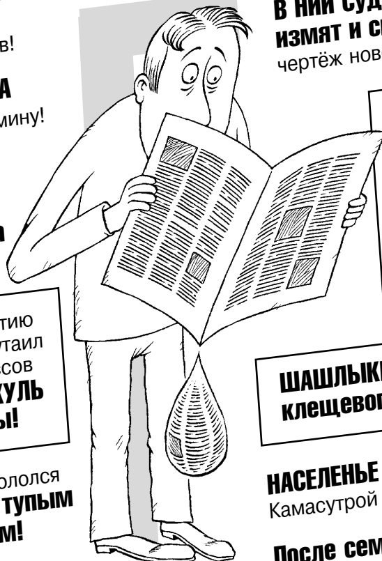
РИС. М. СМАГИНА (ЕКАТЕРИНБУРГ)

После семейного отпуска жена не вернулась к любовнику!